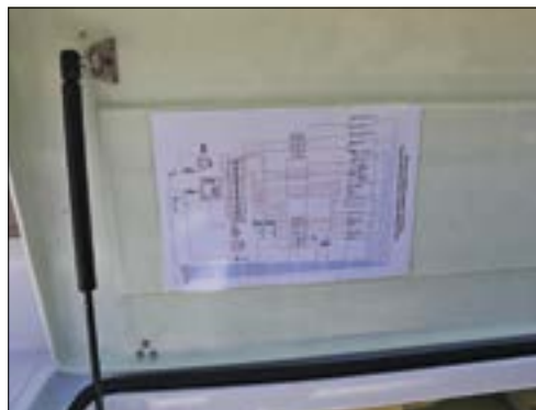
Plangemäß. Die Installation der E-Motor-Anlage ist sauber über einen Schaltplan dokumentiert

Fahreigenschaften. Läuft dank der Edelstahlfinnen wie auf Schienen geradeaus. Leichtgängige Steuerung. Dreht am Teller. Sehr leiser Antrieb. Effizient bis 3 Knoten, ab dann auf Grund des klassischen Motorbootrumpfs höherer Verbrauch als ein reines Elektroboot. Wählt man die richtige Geschwindigkeit, ist die Reichweite auch dank der großen Batteriekapazitäten aber mehr als ausreichend. Nach der Langstrecke waren die Akkus noch immer zu zwei Drittel voll.